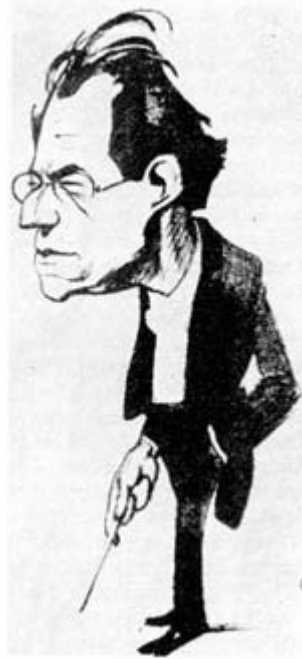
Mahler-Karikatur von Oscar Garvens

Sein Rang als Komponist war trotz seiner Erfolge zu Lebzeiten nach seinem Tod sehr lange umstritten. Es bildete sich zwar schnell eine Gemeinde enthusiastischer Anhänger, aber in der musikinteressierten Öffentlichkeit trafen seine Schöpfungen lange Zeit überwiegend auf Desinteresse, Unverständnis oder Ablehnung. Ursache dieser Reaktionen war auch hier wieder seine jüdische Abstammung. Während der Nazidiktatur war sein Werk schließlich vollkommen verpönt – erst in den 60er Jahren des 20. Jahrhunderts wurde Gustav Mahler als Komponist wieder entdeckt.