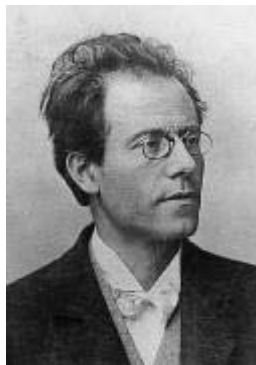
Gustav Mahler in Wien 1898