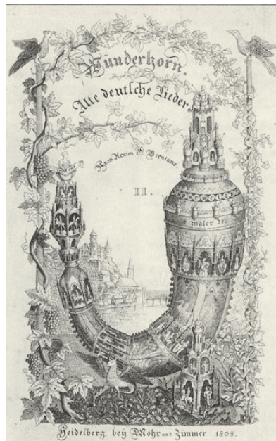
Titelblatt der Sammlung „Des Knaben Wunderhorn“

O Schmerz! Du Alldurchdringer! Dir bin ich entrungen! O Tod! Du Allbezwinger! Nun bist du bezwungen! Mit Flügeln, die ich mir errungen, in heißem Liebesstreben, werde ich entschweben zum Licht, zu dem kein Aug` gedrunge! Sterben werd` ich um zu leben! Aufersteh`n, ja aufersteh`n wirst du, mein Herz, in einem Nu! Was du geschlagen, zu Gott wird es dich tragen!