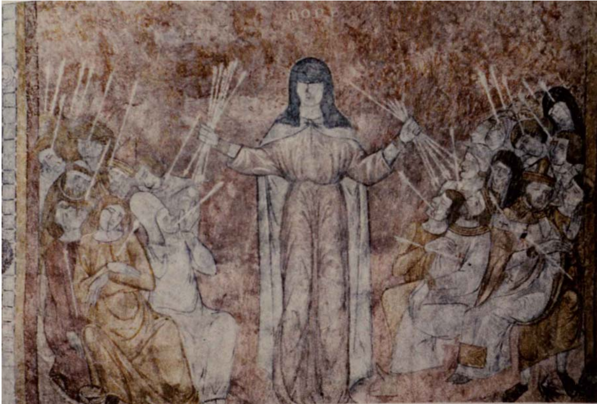
Abb. 4 Die Pest von Lavandieu