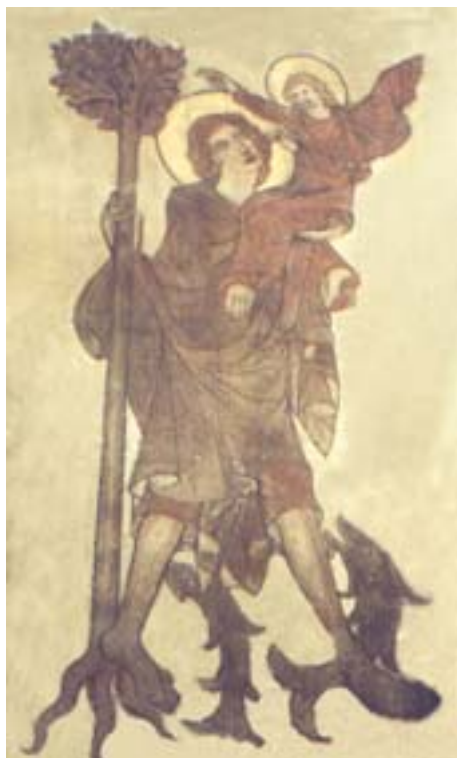
Abb. 1 - Heiliger Christophorus; Marienkirche Reutlingen

Insofern erschließt die Musik des 20. Jahrhunderts auch das Verständnis für sehr alte, beinahe schon entlegene Musik: Sie begegnet dann nicht als ein exotisches Noch-Nicht, sondern wird durch produktiven Umgang Teil einer gegenwärtig bedeutsamen Situation. Das Arrangement ist heikel, es könnte in aufdringliche Belehrung umschlagen. Persönliche Folgerungen sollen deshalb ermöglicht, nicht aber vorweggenommen werden.