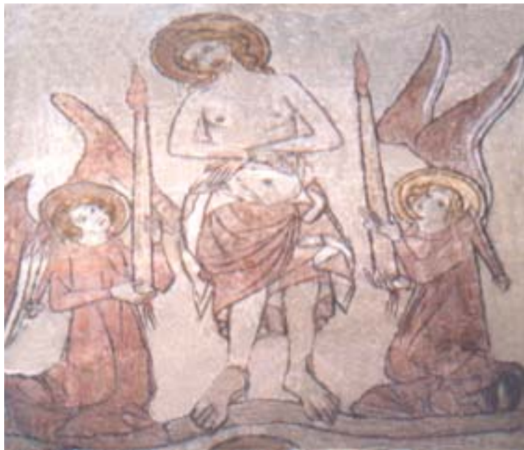
Abb. 8 - Schmerzensmann; Marienkirche Reutlingen

In Schönbergs Komposition „Ein Überlebender aus Warschau“ aber stellen sich die Opfer dem Tod – den Mördern – entgegen; das im Chor gesungene Gebet bezeugt ihre moralische Überlegenheit und gibt uns, den Hörern, Hoffnung.