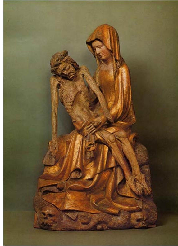
Abbildungen 5 und 6 Pestkreuz, Vesperbild

Christus wird nicht mehr, wie zuvor, als der noch im Tod hoheitsvoll Triumphierende dargestellt. Das andächtige Betrachten des vom Leiden und vom Tod entstellten Gottessohnes soll in Zeiten äußerster Not auch den angsterfüllten Menschen Trost vermitteln. 19