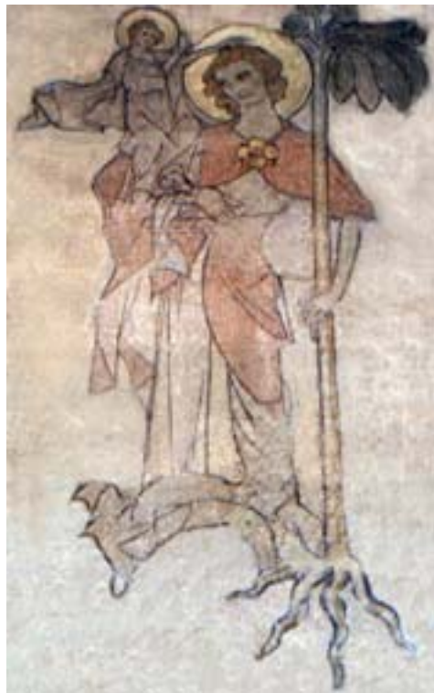
Abb. 3 - Heiliger Christophorus; Marienkirche Reutlingen

Das musikdidaktische Anliegen der Unterrichtsvorschläge sei nochmals herausgestellt: Schönbergs Komposition bedarf weder der musikalischen Analyse noch eines musiktheoretischen Vokabulars, um in ihrer ethischen Bedeutsamkeit erkennbar zu werden. Die Schüler werden die moralische Überlegenheit des gemeinsam gesungenen Gebetes über die stetig sich steigernde, äußere Bedrohung hörend wahrnehmen. 17